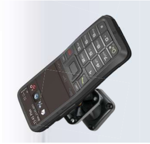
CarPhone mit Befestigungsclip