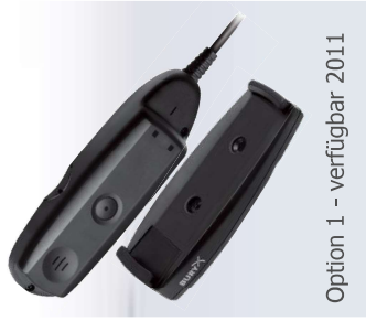
Option 1 - verfügbar 2011