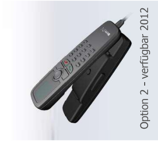
Option 2 - verfügbar 2012