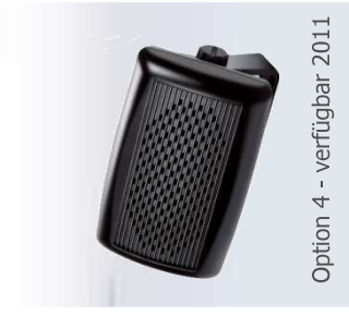
Option 4 - verfügbar 2011