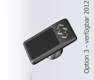
Option 3 - verfügbar 2012