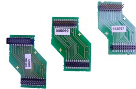
drei Testprint für RE429NT+, RE429NT30 und RE629